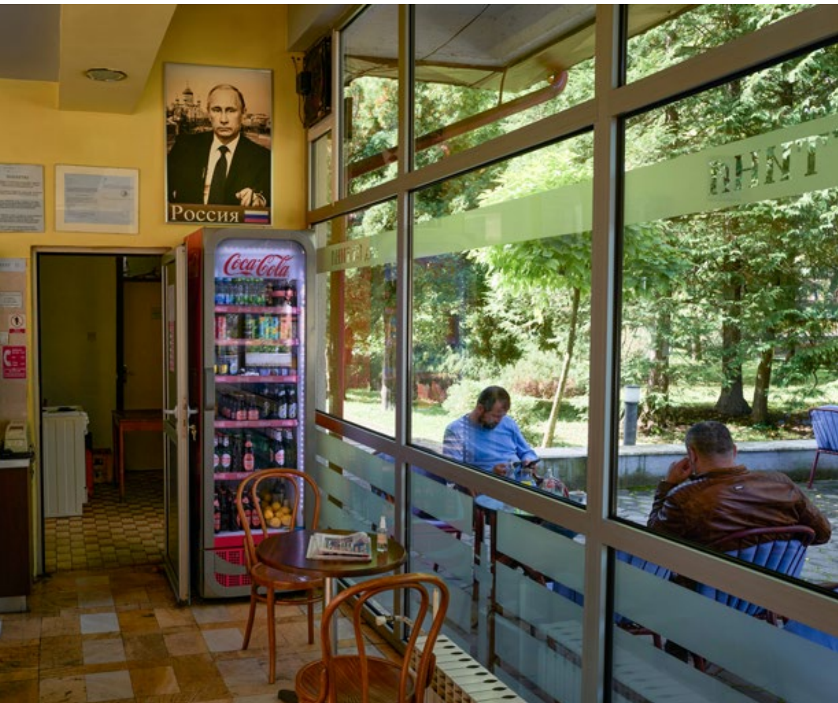
Café Putin in Milici, Bosnië en Herzegovina, september 2022