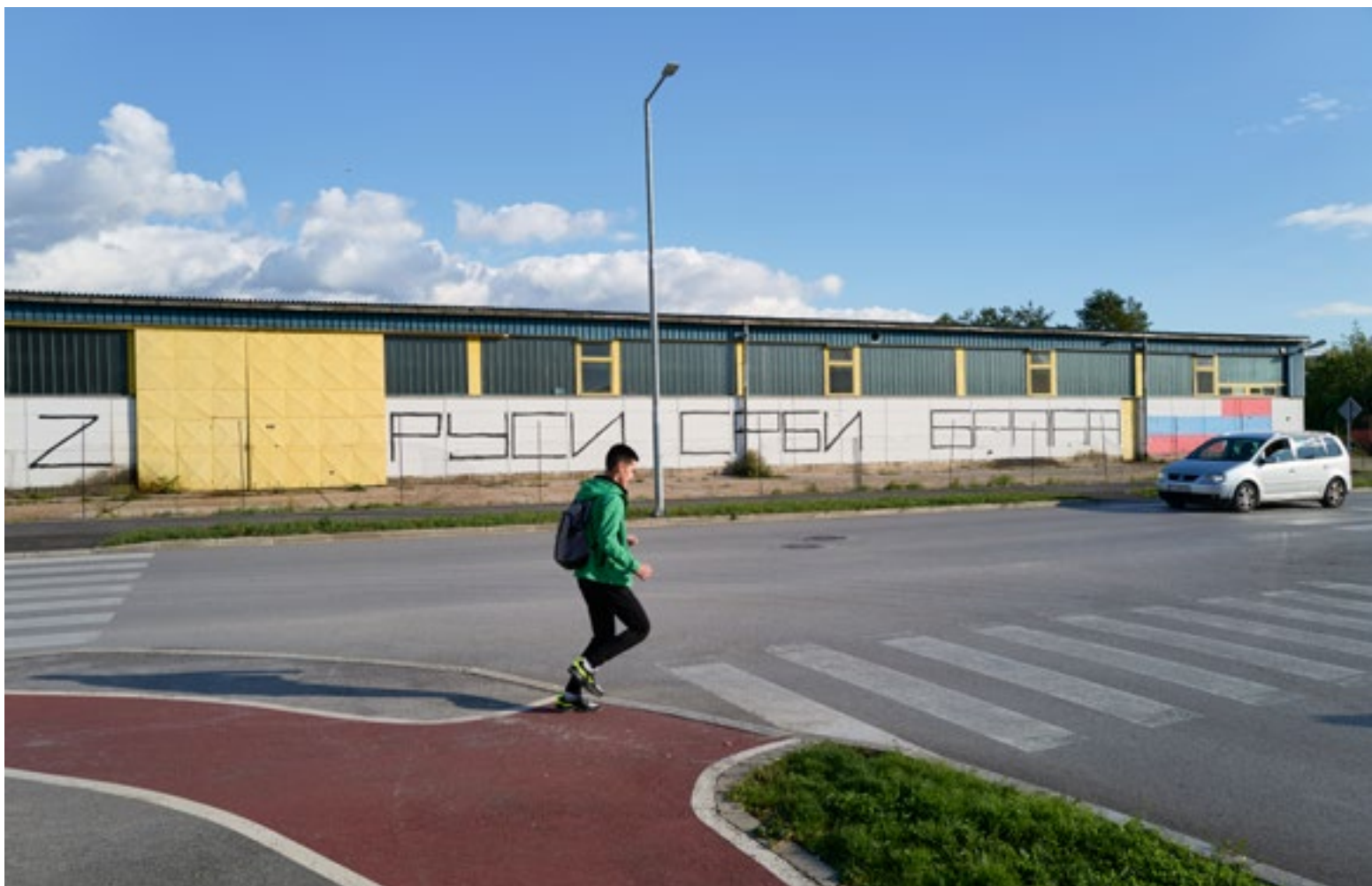
Graffiti ter ondersteuning van Rusland in Republika Srpska, oktober 2022